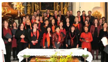
Die Singgemeinschaft Ruprechtshofen & St. Leonhard

Die Singgemeinschaft Ruprechtshofen & St. Leonhard begeisterte am 30. April eine große Besucherzahl. Der Chor, bestehend aus ca. 45 Mitgliedern, unterstützte an diesem Abend mit seinen Stimmen den Entwicklungshilfeclub Wien für das Projekt „Nach vorne schauen“ in Liberia. Das Katholische Bildungswerk dankt der Singgemeinschaft für die schwungvoll gestaltete Abendmesse und das tolle, mitreißende Konzert ganz herzlich! Ein herzliches Dankeschön auch allen Besuchern für ihr Mitfeiern und die großzügige Spende von 830.- Euro. Ika